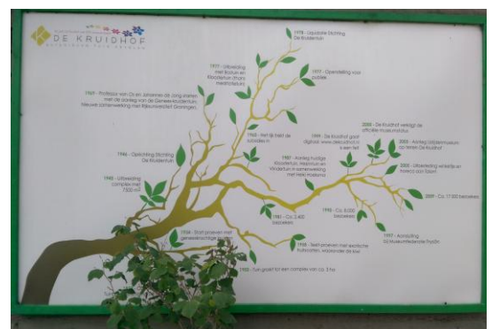
Levensboom van De Kruidhof