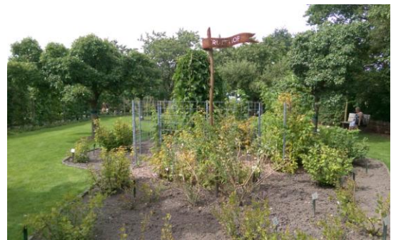
Fruithof van De Kruidhof