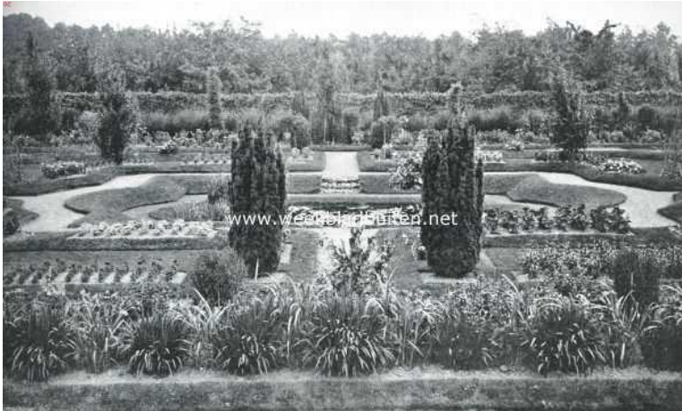
De tuinbouwschool van Frederiksoord vroeger

En zoals de reclame-uiting ook luidt: 'Welkom toen, welkom nu!'